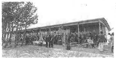
伊勢ヶ崎町立小中学校 伊勢ヶ崎町立小中学校の新しい校舎。木材を使用した外観が特徴的だ。

ナタツカOSB、震災の記憶を風化させないために震災の話を伝えるために、関するDVD、メイプル館はDなどを上掲する場所も設けている。ゆりあ