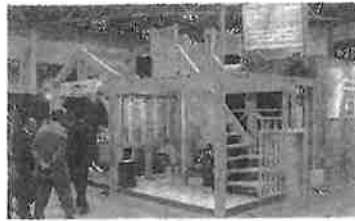
カナダツガの強さを、展示会などの機会に積極的にPRしている。