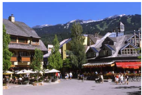
ウイスラー・ヴィレッジ